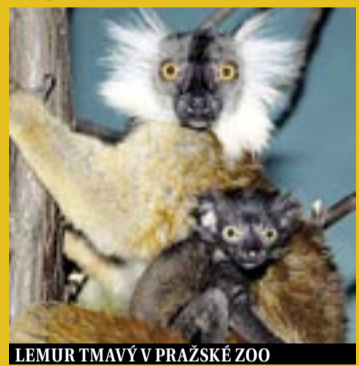
LEMUR TMAVÝ V PRAŽSKÉ ZOO

Červen v zoo patří především mládatům. Stačí jen pozorně si všimnout a určitě jich objevíte spoustu. Za návštěvu stojí nejen venkovní výběh pavilonu goril, kde se malá Moja začala seznamovat s velkým světem pod širým nebem, ale také mláďata tučňáků, pelikánů, čápů, antilop, dikobrazů nebo nosálů. Skupinka jihoamerických nosálů červených obývá poměrně novou expozici ve střední části zoo. Jsou to nesmírně čiperná a hravá zvířata, která neustále pátrají po něčem k snědku nebo obratně šplhají po stromech. A za povšimnutí stojí i rodinka madagaskarských poloopic lemurů tmavých. Černý sameček Kiwi a hnědá samička Meg obývají expozici v pavilonu Afrika zblízka. Koncem března se jim narodil syn, který byl zpočátku schovaný v boudičce, ale dnes už dovádí v expozici.