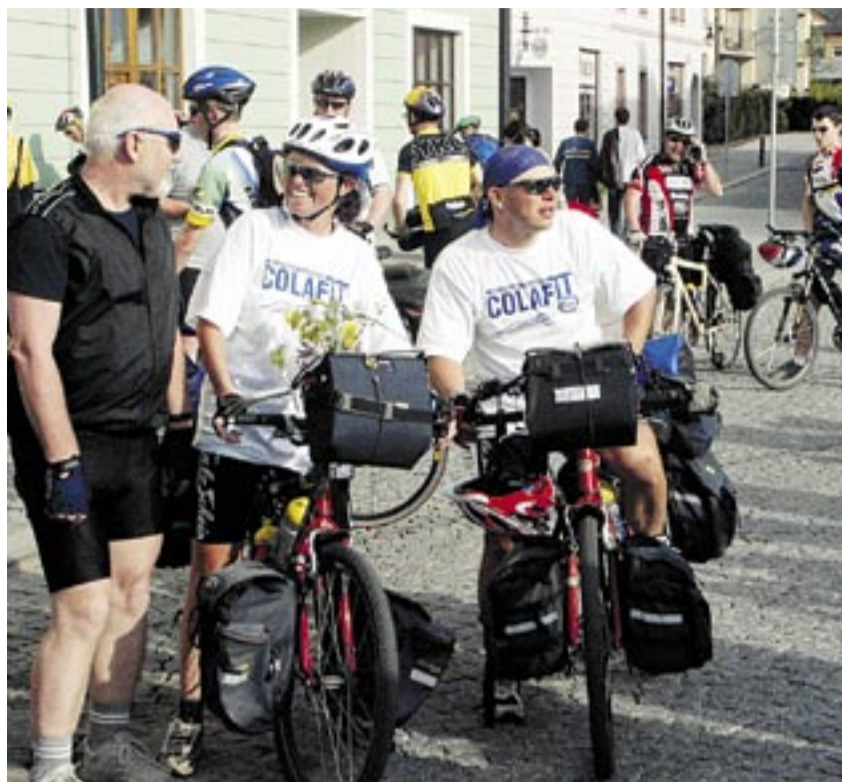
PŘED STARTEM. Poslední etapa z Berouna do Prahy.

V dohledné době bude v Praze opět zprovozněn Sedlcký přívoz, který spojí oba břehy Vltavy přibližně mezi Sedlcem a útlukem pro psy v Zámčích na trojské straně řeky. Přívoz bude sloužit nejen místním obyvatelům, ale propojí se také cyklotrasy levooběžní s pravoběžní číslo 2. Dojde tak k propojení Šárky