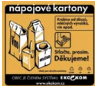
Nálepka na nádoby určené pro sběr nápojových kartonů

o která je zájem v papírnách. A kde skončí nápojové obaly vytříděné Pražany? Vytříděné kartony z celé Prahy se nejprve navězou na speciální linku, kde budou sliso-vány do balíků a ty se pak odvezou k odběrateli na recyklační zpracování. V současné době probíhají jednání s papírnou Bělá pod Bezdězem, která je vybavena za-