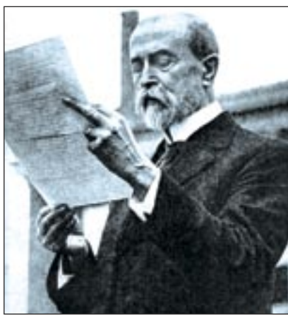
Tomáš Garrigue Masaryk čte ve Philadelphii prohlášení Demokratické unie střední Evropy.

Mezitím se výrazně změnila i domácí politická scéna. Všechny naděje na ruskou pomoc pohřbila porážka carských armád u Gorlice v květnu 1915. Česká politika upadla opět do hluboké deprese. Mezi Čechy se