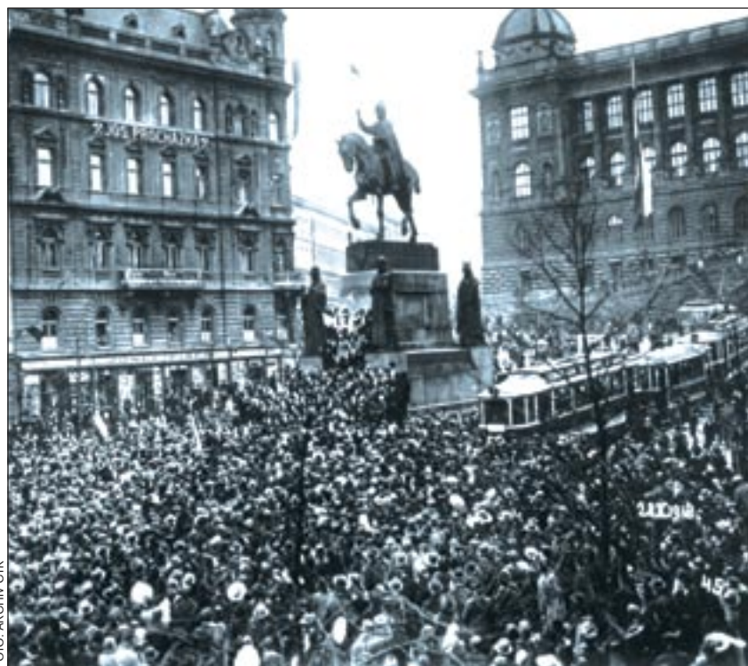
Praha – 28. říjen 1918 na Václavském náměstí.

V prosinci 1914 odešel do emigrace. Je- ho postavení zpočátku vypadalo bezna- dějně. Jediné na co se mohl spolehnout