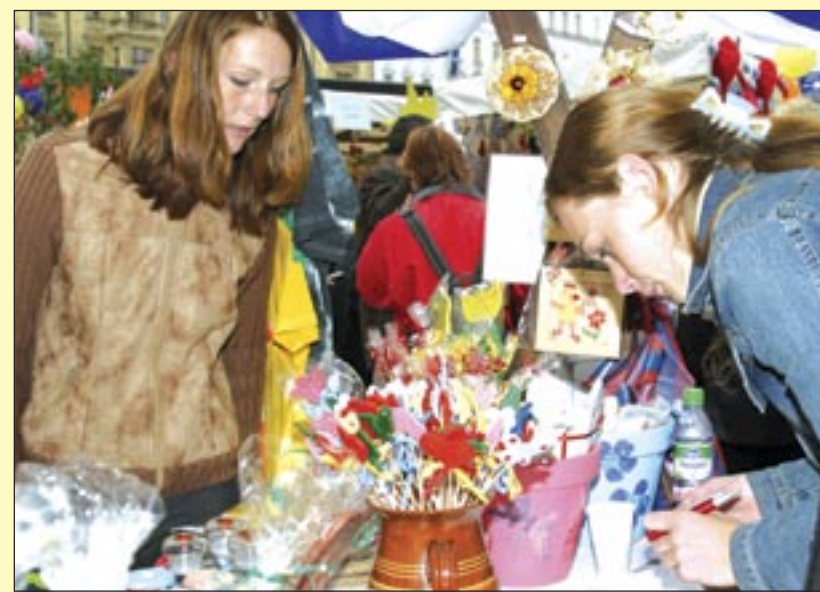
Celostátní kolo se konalo na Náměstí Republiky v Praze.