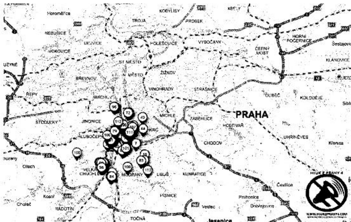
Příloha č. 1 – Mapy zasaženého území, dle patentů u kterých je přesněji specifikováno bydlíště