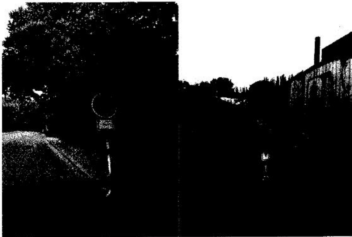
Příloha č. 1