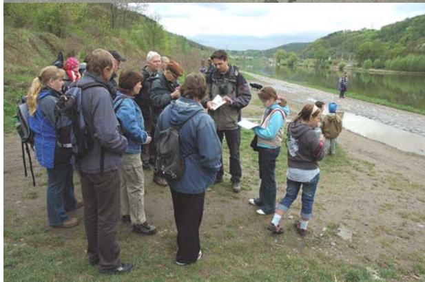
Foto 1-3: Z vycházky za ptáky do přírodního parku Draha-Troja dne 18.4.2009