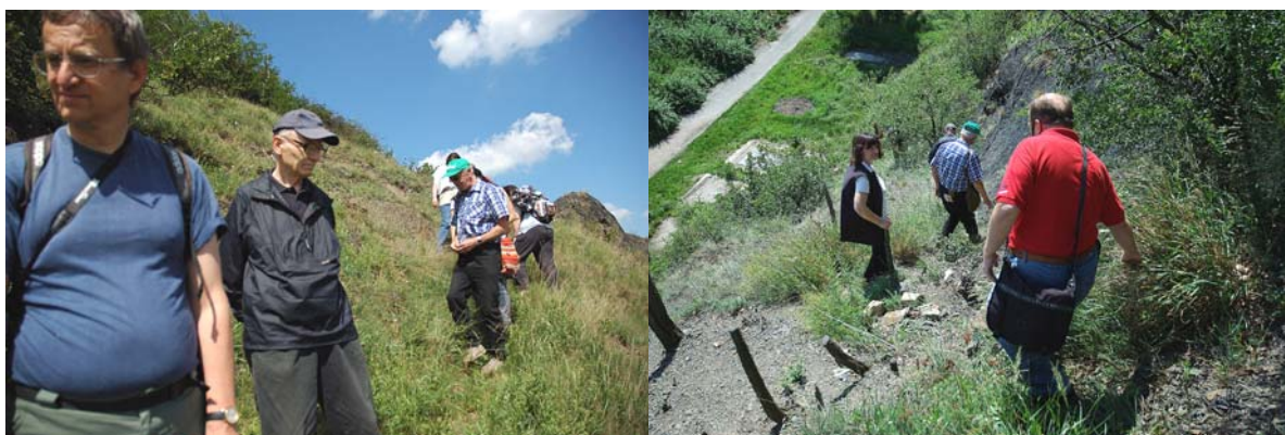
Foto 4-5: Z vycházky do PP Jabloňka dne 23.5.2009