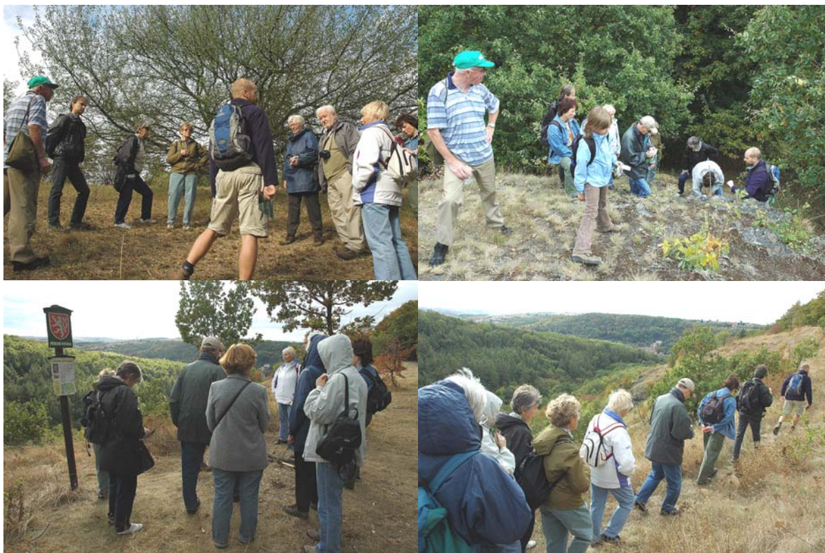
Foto 7-11: Z vycházky do přírodních památek Čimické údolí a Bohnické údolí dne 4.10.2009