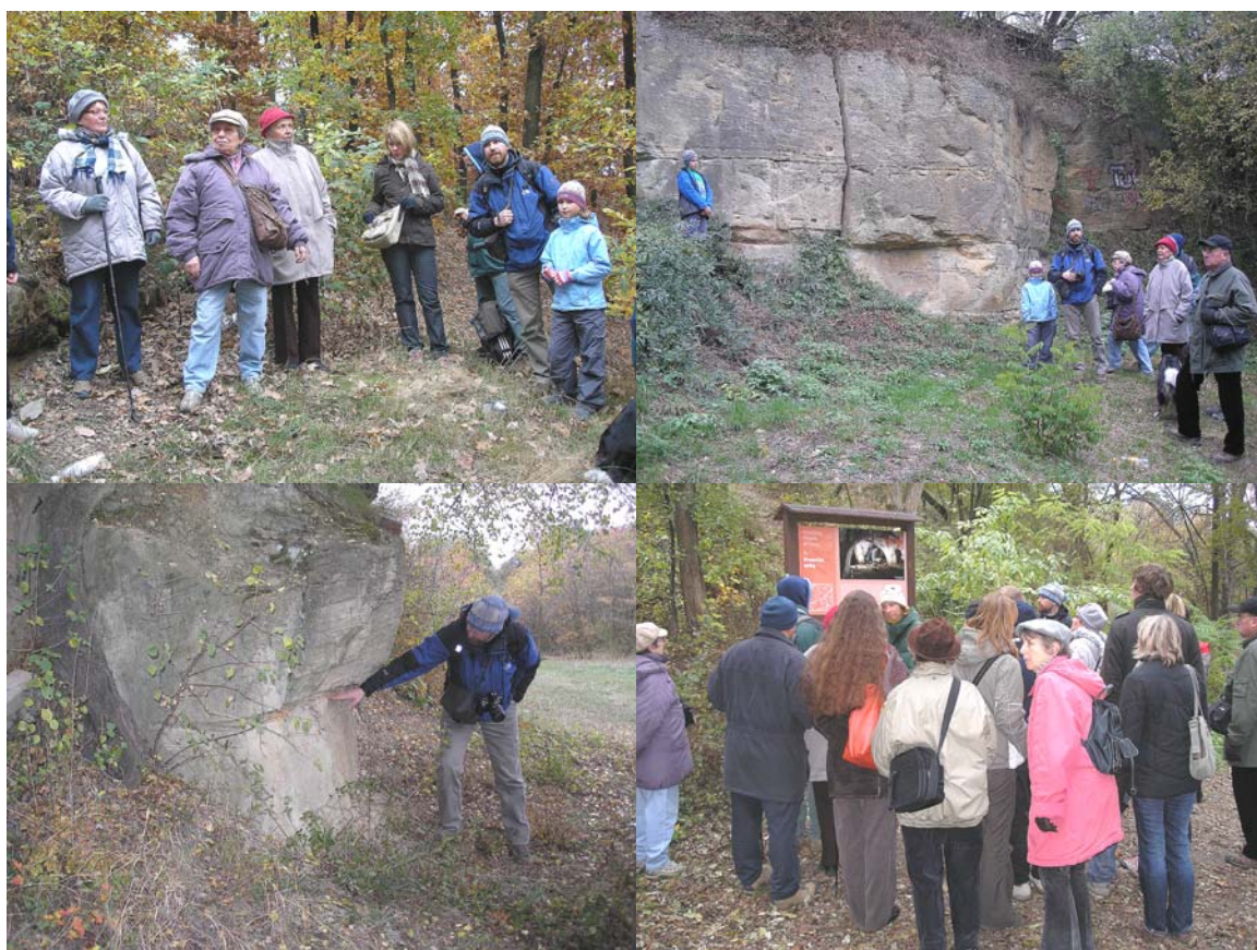
Foto 12-15: Z vycházky do přírodních památek Okrouhlík a Prosecké skály dne 1.11.2009