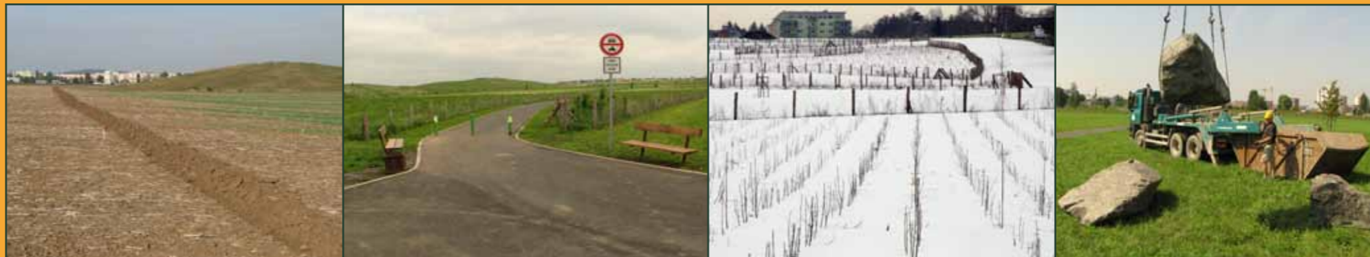
Lesopark Letňany v roce 2008 - vytyčení a oddělení plochy budoucího lesoparku od lánu orné půdy Vstup do lesoparku v roce 2010

Do konce 19. století na území Prahy nebyly nové lesy zakládány, spíše lesy ubývaly a půda byla využívána na pole a pastviny. Mezi lety 1903 a 1914 však bylo v Praze poprvé zalesněno 80 ha a v dalších letech nové lesy přibývaly. Jen mezi