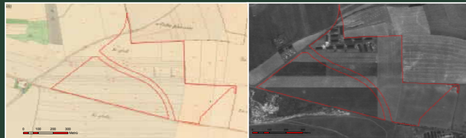
▲ Území lesoparku na mapě stabilního katastru z roku 1848 Území lesoparku v roce 1953 ▲ Červeně je vyznačena hranice současného lesa v majetku hl. m. Prahy.

Původně se na celé ploše lesoparku nacházela pole (viz mapa z roku 1848), po roce 1950 bylo v severní části, pod dnešním umělým kopcem, postaveno 16 provizorních budov, které sloužily jako sklady podniku Rudý Letov (viz mapa z roku 1953). V 80. letech se postupně tyto objekty likvidovaly a v roce 1988 zde již stály jen 3. Od poloviny 90. let až do roku 2002 byla plocha využívána jako deponie výkopových materiálů ze stavby metra. V roce 2002 pozemky získalo hl. m. Praha koupí v dražbě od společnosti Letov a.s. V roce 2007 pak byla zpracována úvodní studie lesoparku, která byla následně dopracována do podoby projektu k územnímu rozhodnutí a následně stavebnímu povolení. Po dokončení výsadby na rovinaté jižní části lesoparku byla v roce 2011 provedena rekultivace severního cípu na ploše okolo bývalé železniční vlečky. Zde bylo mimo jiné odvezeno více než 600 m 3 komunálního odpadu, betonu a jiných materiálů. Na jaře 2012 byla celá zrekultivovaná a ohumusovaná plocha osázena dřevinami. V létě 2011 byla také jižní část lesoparku oživena rozmístěním 2 skupin balvanů. Jeden balvan byl také umístěn na vrchol vyššího kopce, který nabízí zajímavý výhled, jak na letiště Letňany, tak i do Polabí.