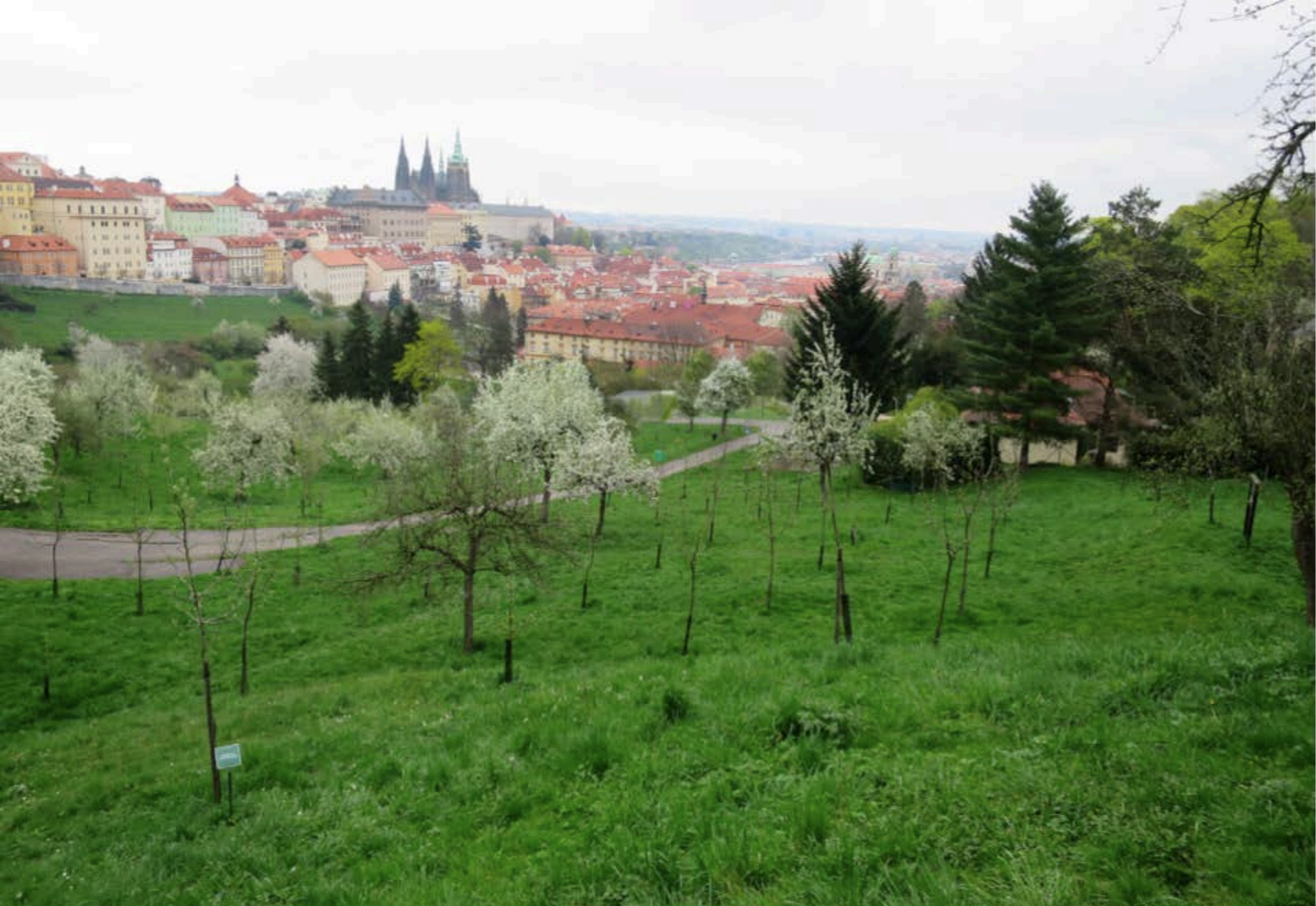
pohled z promenády Rosolu Wallenberga (zářek do fotky v jarním období) 10/10/2019