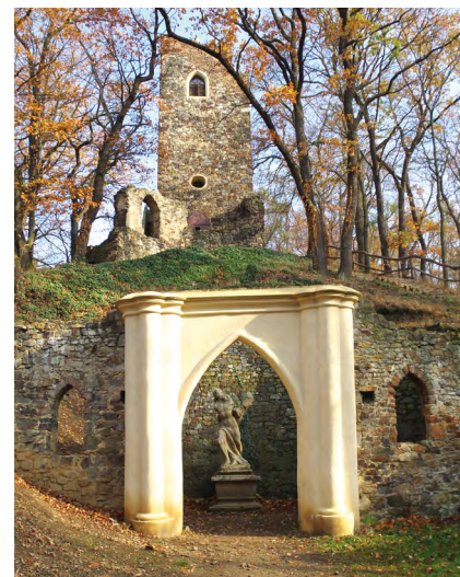
Na fotografiích: vyhlídková věž Cibulka, vpravo nahore - jezírko Pod Dianou, vpravo dole - ovocný sad Cibulka.