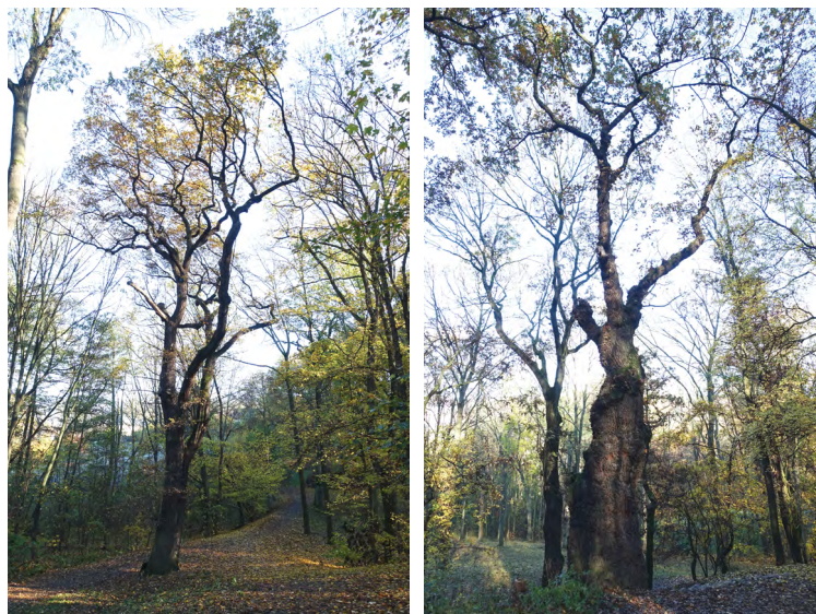
Na fotografiích: Dub letní v lesoparku Na Cibulkách - č.80, Dub s bizarním tvarem kmene Na Cibulkách - č.94.

Vydalo Hlavní město Praha, Odbor ochrany prostředí MHMP v únoru 2022. Autor textu: Aleš Rudl. 1.vydání. Neprodejné. ISBN 978-80-7647-076-7