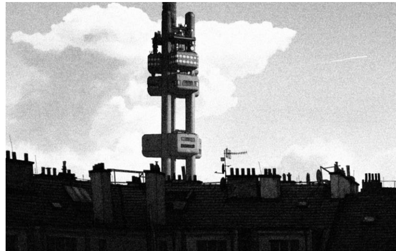
Animovaný snímek Hurikán (Jan Saska)