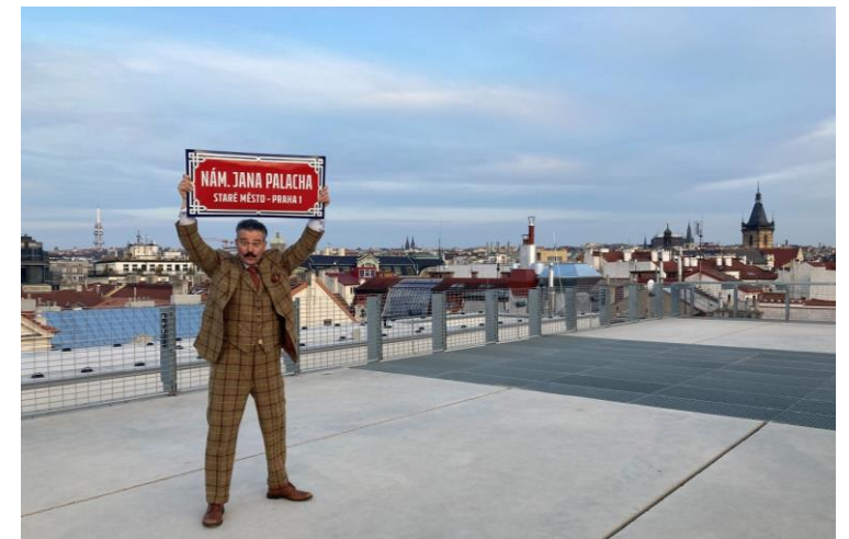
Dokumentární film Bohemian Identity