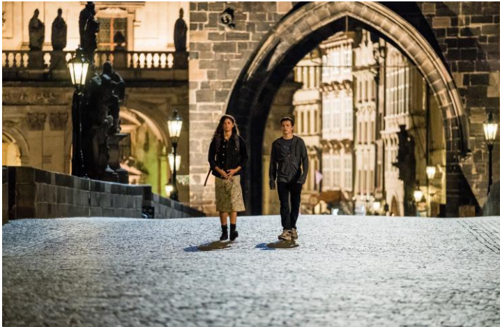
Spider-Man: Daleko od domova