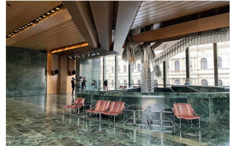
Dokumentární série Architektura ČSSR 58-89