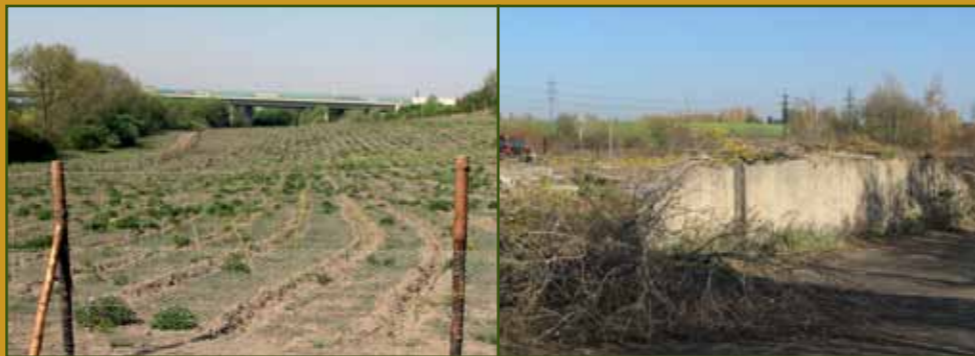
Nové vysázený les

Červeně je vyznačena hranice současného lesa v majetku hl. m. Prahy. Z mapy je patrné, že ne území lesa se historicky nacházela pouze pole a louky.