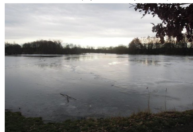
Přírodní památka V Pískovně.

Alternativně můžete dojít k Poděbradské ulici také od PP Pražský zlom a využít zde tramvajové a autobusové linky jedoucí směrem ke stanici metra Hloubětín (např. ze zast. Starý Hloubětín).