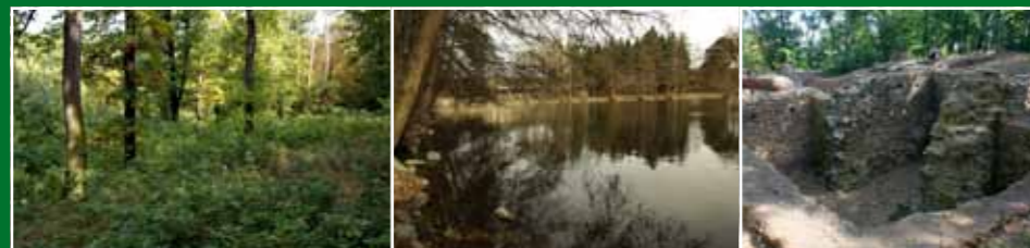
Přirozené zmlazení dubu

V Kunratickém lese převažují porosty dubu a smrku. Smrkové monokultury se však postupně přeměňují na smíšené porosty, blíží se původnímu přirozenému složení porostů v dané lokalitě. V lese jsou prováděny prořezávky v mladých porostech do výšky sedmi metrů. Probírky středně starých porostů slouží zejména k úpravě dřevinné skladby a odstranění poškozených nebo nekvalitních jedinců. V případě starých smrkových porostů je prováděna obnova maloplošnými zásahy. Na uvolněné plochy jsou následně vysázeny směsy vhodných dřevin včetně některých nepůvodních druhů – douglaska, modřín. Na vhodná stanoviště je už 15 let také vysazována jedle. Velký důraz je kladen na obnovu lesa přirozeným zmlazením (především dubu). Tyto zásahy směřující k vyšší přirozenosti lesních porostů jsou prováděny i v chráněném území Údolí Kunratického potoka.