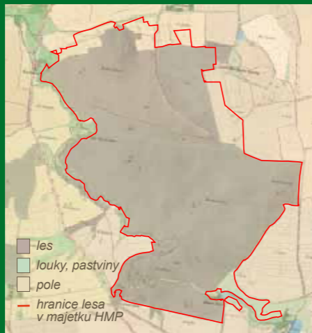
Území Kunratického lesa na mapě stabilního katastru z roku 1848

Severní část lesa patřila od 15. století Univerzitě Karlově. Na město Prahu byla převedena až v roce 1963. Jen část lesa, která se nachází u Chodova, byla zalesněna až po 2. světové válce na původně zemědělských půdách, jinak se jedná o historicky zalesněné území. Z počátku 20. století pochází rozsáhlé smrkové monokultury, které vypovídají o tzv. „smrkové máni“ v tomto období.