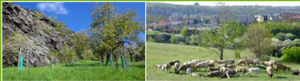
Sad pod Kozákovou skálou

Červeně je vyznačena hranice současného lesa v majetku hl. m. Prahy. Z mapy je patrné, kde se historicky nacházely lesy a která území byla zalesněna později.