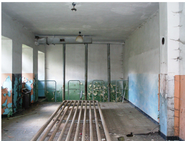
Bystřice, bývalá rota pohraniční stáže, © Česká filmová komora

pohraniční stráž je nyní v majetku města Domažlice. Tato rozlehlá, opuštěná, a chátrající budova skýtá nejedno zákoutí pro zajímavé filmové využití.