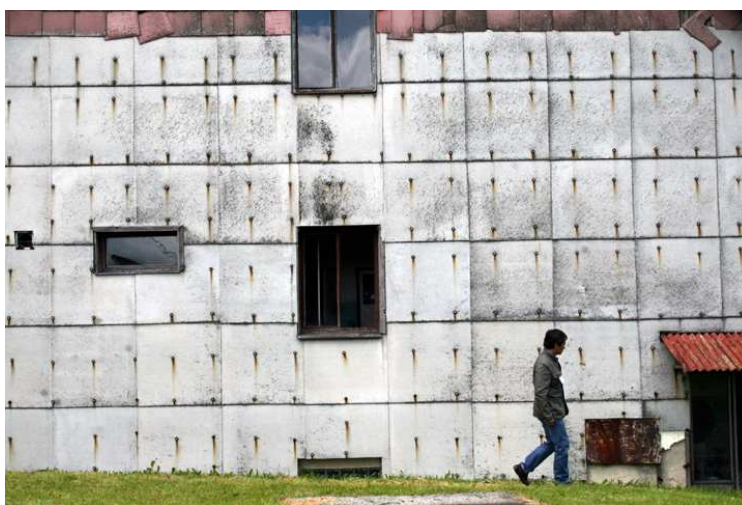
Konec studené války na Čerchově

Protipólem na české straně bylo vojenské stanoviště na hoře Čerchov, se svými 1042 metry nejvyšším vrcholu Českého lesa. Vedle kamenné rozhledny z roku 1905 (Kurzova rozhledna) se zde nachází několik opuštěných bývalých objektů ČSLA, nyní ve vlastnictví města Domažlice. Vedle československé a sovětské armády využívala stanoviště na Čechově pro své odposlechy i tajná policie NDR. Vojenská věž, sousedící s rozhlednou, byla postavena v polovině 80. let, je stále v provozu a ve vlastnictví armády.