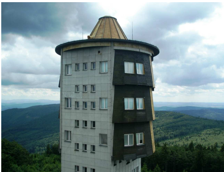
Vojenská věž na Čerchově, © Česká filmová komora

Zajímavý den na lokacích v bavorsko-českém pohraničí strávili společně němečtí a čeští filmaři. Location Tour po stopách "studené války" organizovala FFF Film Commission Bayern (filmová komise regionu Bavorsko) ve spolupráci s Czech Film Commission a pozvání využilo přes 40 filmových profesionálů z obou zemí. Tour je přivedla především na dvě místa ztělesňující studenou válku – vojenská stanoviště na Čerchově a Hoher Bogen.