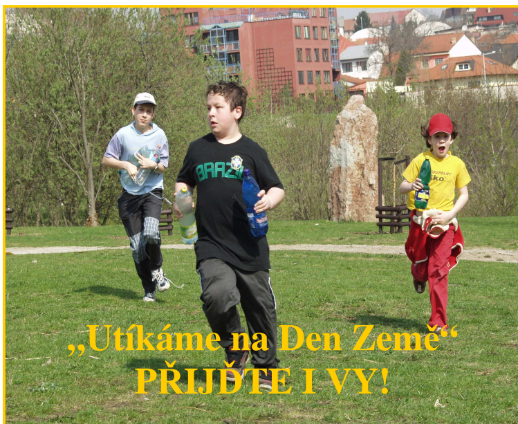
Foto z Dne Země 2006

Sdružení TEREZA ve spolupráci s Odborem životního prostředí ÚMČ Praha 13 a dalšími organizacemi připravuje na celou sobotu spoustu her, zábavy i poučení pro malé i velké.