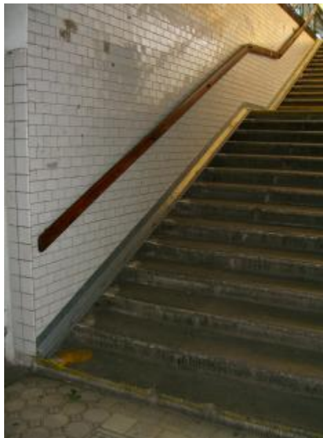
foto 1: Plzeňské hlavní nádraží, kde jsou umístěny žlábků (bohužel jsou úzké, správně je třeba je provést ještě min o 7 cm širší).

V případě nemožnosti napojení na obytnou oblast Žižkova rampami, řešit na schodištích alespoň žlábků podobné těm, na fotografiích níže